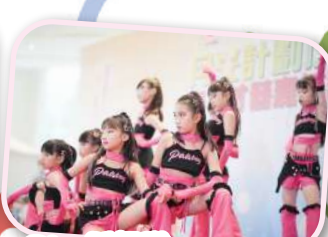
青年才藝嘉年華 Dazzling Star 跳舞隊