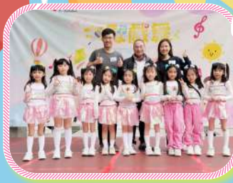
K POP @童樂會 參加「文歌戲舞」比賽